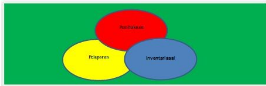
Gambar 1. Proses Penatausahaan Barang Milik Negara

Penatausahaan Barang Milik Negara bertujuan untuk mewujudkan tertib administrasi dan mendukung tertib pengelolaan Barang Milik Negara yang meliputi penatausahaan pada Pengguna Barang serta Pengelola Barang sebagaimana diatur dalam Peraturan Menteri Keuangan Nomor: 181/PMK.06/2016 tentang Penatausahaan Barang Milik Negara.